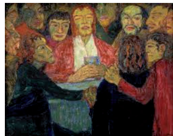
Emil Nolde: Den sidste Nadver. Statens Museum for Kunst.