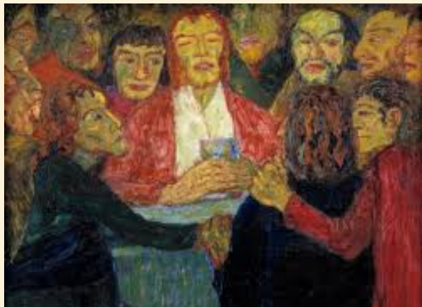
Emil Nolde: Den sidste Nadver. Statens Museum for Kunst.