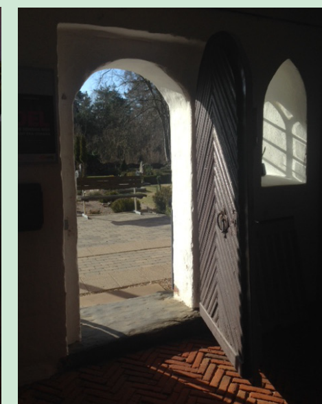
Billeder af Rørvig Kirke.